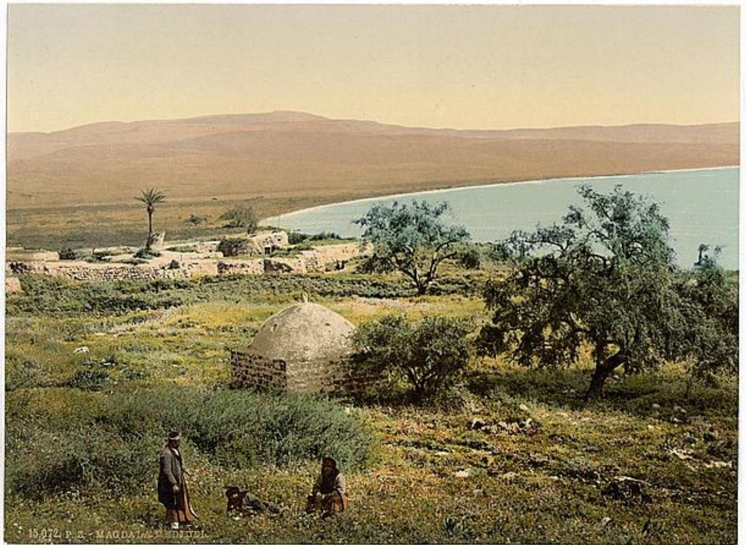
הנוף מהמושבה מגדל, ראשית המאה ה-20