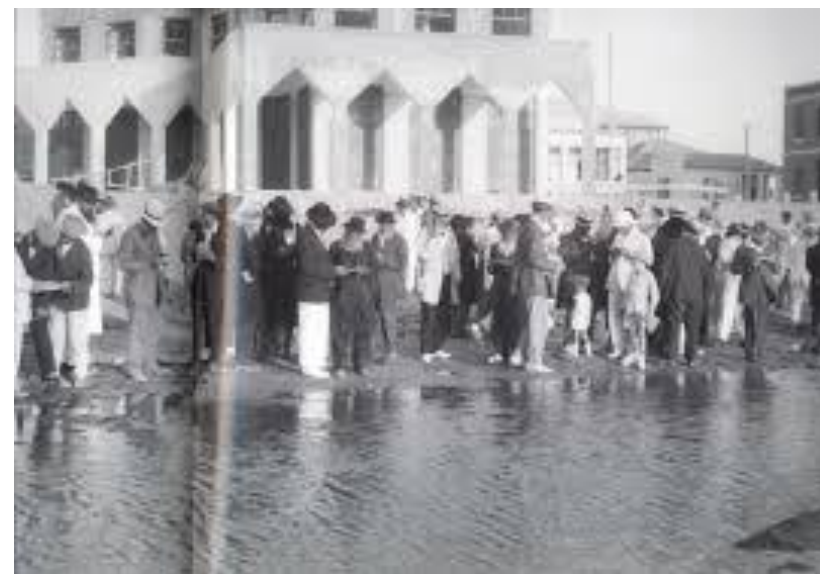
תשליך בתל אביב

עוד שמעתי רמז גדול ונכון, כי הולכים למים שיש שם דגים, יען כי להדגים אין גבינים, ועיניהם תמיד פקוחות, כדי להתעורר עיני פקיחא דלעילא, שרומז על רחמים גדולים. והנה לא ינום ולא יישן שומר ישראל, רק עיניו פקוחות. ועל זה נאמר עורה למה תישן, וכתיב למה יעשן אפך בצאן מרעיתך, כי קשה העשן לעיניים וגורם שיהיו סגורות, ונחנו מתפללים שיהיו פקוחות [...] באם הוא באופן, שמתעורר בתשובה שלימה בלבו, ומשליך מעליו גילוליו, אז נופלים הם במצולות ים.