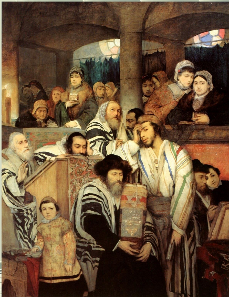
מאוריצי גוטליב (1858)